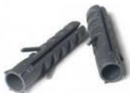
Рисунок.2: Внешний вид пластикового дюбеля.

а) с помощью пластиковых дюбелей (тип и размеры указываются в проекте на монтаж системы диспетчерского контроля), устанавливаемых в просверленные (пробитые) гнезда (пример пластикового дюбеля представлен на рисунке 2);